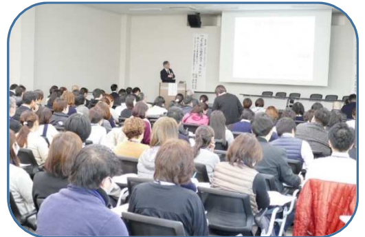
164名が参加しました！

当医師会も、今後さらにACPの考え方を広めていくために行政（地域包括）や多職種の方々と一緒にサポート体制構築し、市民さんへの普及啓発に繋げていきたいと思っております。